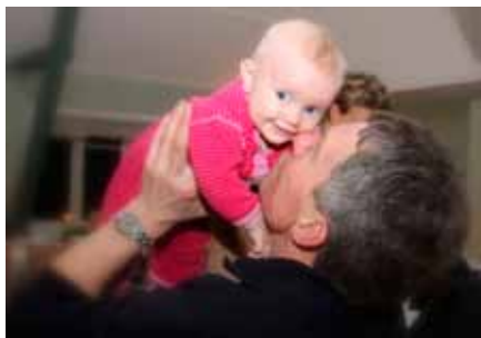
Se flere på www.ubberupvalgmenighed.dk.

Vi fik fornemt besøg: Selveste Betlehemsstjernen og en af de vise mænd fra Østerland kiggede forbi!