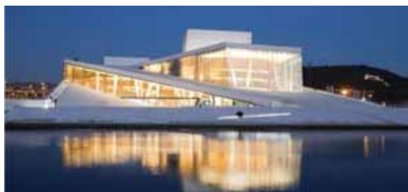
Operaen i Oslo