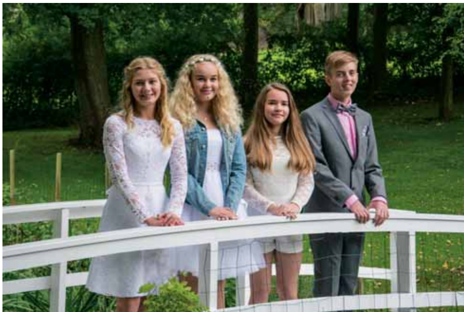
Konfirmationen 2017.